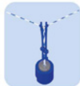
ΣΥΣΤΗΜΑ ΣΥΓΚΡΑΤΗΣΗΣ ΣΥΡΜΑΤΟΣ