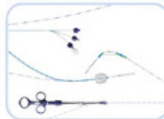
ΣΥΣΤΗΜΑΤΑ ΤΑΧΕΙΑΣ ΑΝΤΑΛΛΑΓΗΣ (SHORT TRACK)