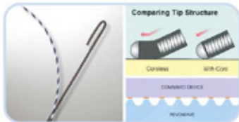
RENEWAVE ΤΕΧΝΟΛΟΓΙΑ ΔΙΧΜΗΣ ΑΠΟ ΙΑΠΩΝΙΑ ΜΟΝΑΔΙΚΟΣ ΚΥΜΑΤΟΕΙΔΗΣ ΣΧΗΜΑΤΙΣΜΟΣ ΓΙΑ ΕΥΚΟΛΟΤΕΡΗ ΠΡΩΘΗΣΗ