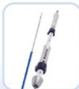
ΜΟΝΑΔΙΚΟΣ ΜΗΧΑΝΙΣΜΟΣ TWIST LOCK ΓΙΑ ΑΝΟΙΓΜΑ ΒΕΛΟΝΑΣ ΚΑΙ ΘΗΚΑΡΙΟΥ ΜΕ ΤΟ ΕΝΑ ΧΕΡΙ