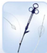
ΚΑΛΩΔΙΑ ΣΥΛΛΗΨΗΣ ΛΙΘΩΝ Σ ΣΥΡΜΑΤΩΝ ΜΕ ΔΥΝΑΤΟΤΗΤΑ ΠΡΩΘΗΣΗΣ ΤΟΥ ΣΥΡΜΑΤΟΣ ΜΕΣΩ ΤΟΥ ΤΕΛΙΚΟΥ ΑΚΡΟΥ ΤΟΥ ΚΑΘΗΤΗΡΑ