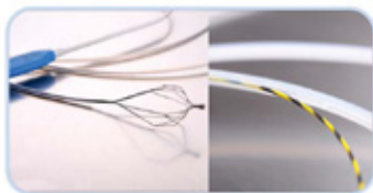
ΚΑΛΩΔΙΑ ΣΥΛΛΗΨΗΣ ΛΙΘΩΝ ΣΕ ΣΧΗΜΑ ΑΝΘΟΥΣ ΣΥΜΒΑΤΑ ΜΕ ΟΛΕΣ ΤΙΣ ΤΕΧΝΙΚΕΣ